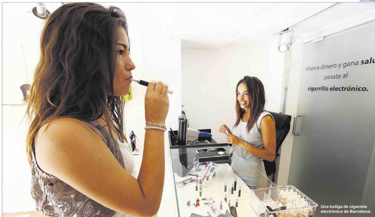
Una botiga de cigarets electrònics de Barcelona.