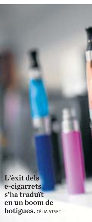
L'èxit dels e-cigarrets s'ha traduït en un boom de botigues. CÈLIA ATSET

Com la majoria de fumadors, el tabac és per a Sendra un hàbit que va molt més enllà del cigarret. "Per a mi un cigarret és una crossa", explica. "Quan estava a l'ordinador, quan parlava per telèfon, quan prenia un cafè, sempre necessitava tenir un cigarret a la mà", assegura Sendra. I afegeix: "Ara el cigarret electrònic també em permet fer-ho i per això em va tan bé". No obstant això, aquesta substitució pot ser poc be-