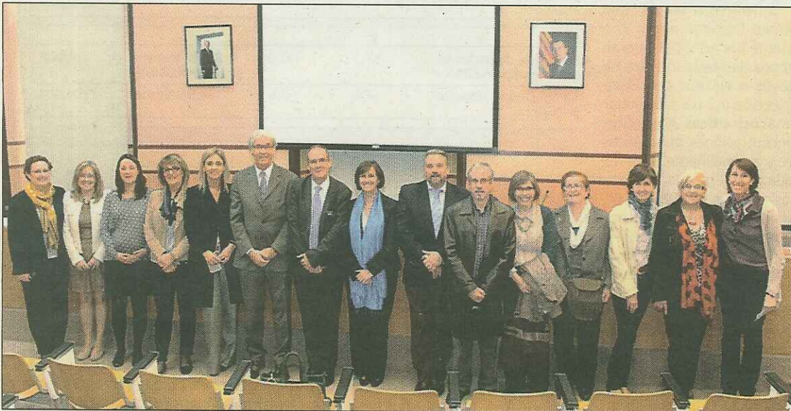
Responsables de la Unitat amb representants del Consell Consultiu de Pacients, durant l'acte de presentació de aquesta nova iniciativa, pionera a nivell estatal, que vol implantar els protocols desenvolupats per l'Hospital Brigham and Women's de Boston.

En el marc de l'aliança estratègica i del treball conjunt entre la Unitat d'Al·lèrgia a Medicaments de l'Hospital Sant Joan Despí Moisès Broggi i l'Institut Oncològic Català, Catalunya ha posat en marxa la primera Unitat monogràfica de Dessensibilització a Quimioteràpics i Anticòssos Monoclonals.