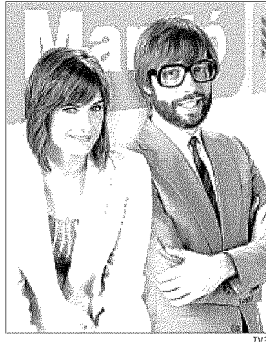
Oltra i Dalmau