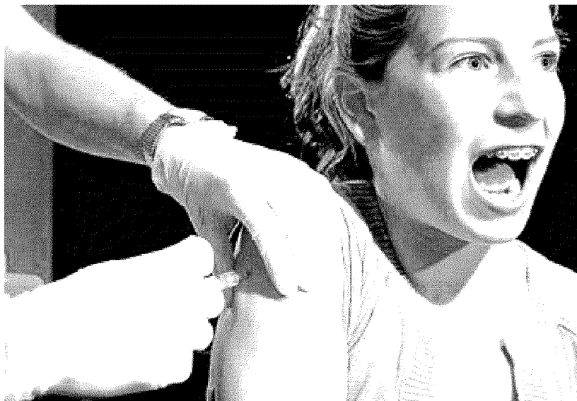
La vacuna contra el virus del papil·loma humà es posa per evitar el càncer d'úter. A Catalunya es va començar a administrar el 2008.

Un altre tema és el debat sobre la vacuna contra el virus del papil·loma humà. Per una banda, hi ha un grup creixent d'experts que qüestionen si està justificada com a mesura de salut pública, mesurant cost i benefici, ja que amb les citologies ja es detecten les lesions i, de totes maneres, malgrat la vacuna, cal continuar fent-les a partir de les edats indicades. Per l'altra, hi ha un petit nombre de noies que han patit efectes secundaris i aquest mateix grup d'experts han criticat que s'hagi posat al mercat quan encara no es coneixen del tot en quins casos se'n poden produir. La vacuna es va començar a administrar a Catalunya el 2008, quan ja s'havien fet tots els assajos clínics, fins a la fase III, amb milers de dones. Ara bé, existeix un període de fase IV, quan ja s'està fent servir, en el qual es continuen recollint dades sobre els seus efectes adversos i que pot portar a prendre altres decisions. ■