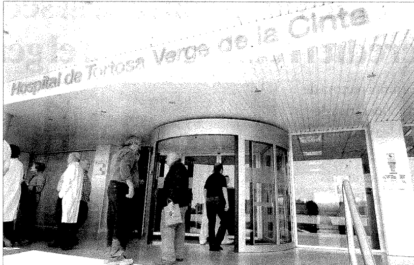
Les mostres de femta s'analitzaran al laboratori de l'Hospital Verge de la Cinta.

Un cop analitzades les mostres al laboratori de l'Hospital Verge de la Cinta de Tortosa, el Departament informarà per carta els