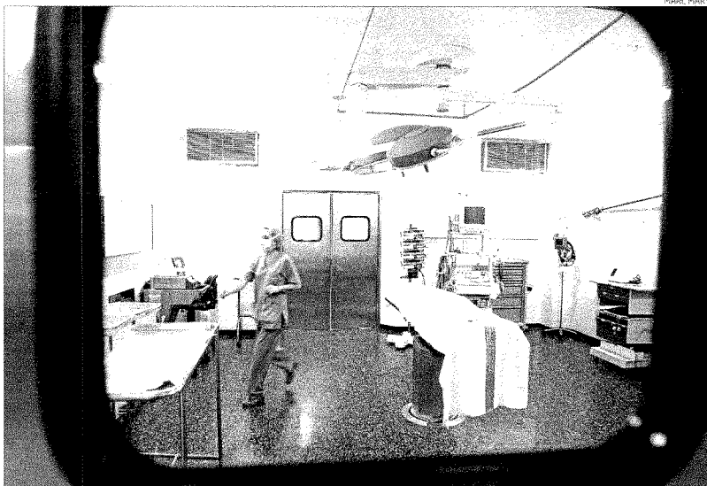
Un quiròfan de l'hospital Trueta.

Per tal d'elaborar aquestes guies de consens, s'han reunit un o dos representants de cada país, els més experts en la matèria, per posar en comú quins són els millors