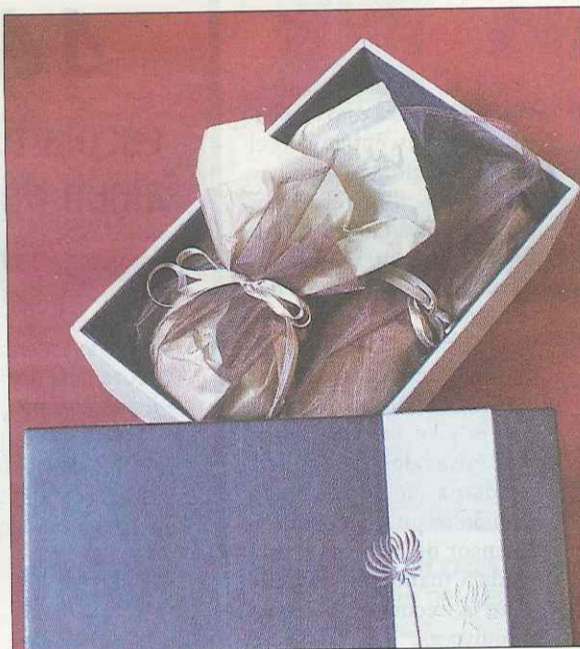
El médico justifica los regalos que reciben, según un estudio.