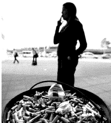
La norma ha desnormalizado el tabaco en las oficinas.

En estos cuatro años, el número de personas expuestas al humo se ha reducido a la mitad, aunque el estudio insiste en que los trabajadores de bares y restaurantes en los que aún se permite fumar siguen sin estar protegidos. Y es que "según las estimaciones más optimistas, sólo el 15% de lo-