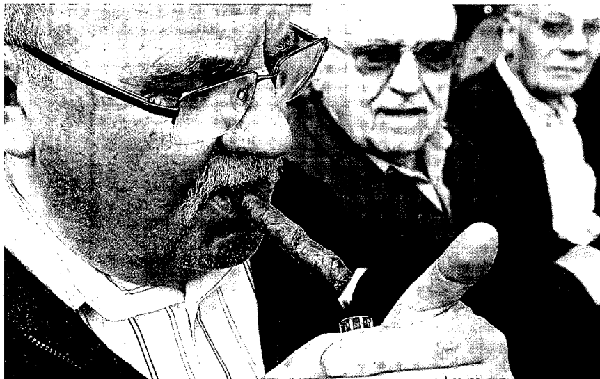
Según la última encuesta estatal de salud, fuman casi tres de cada diez españoles.

Los expertos señalaron además la “disparidad” de las cifras y resultados obtenidos en función del gobierno autonómico, ya que la ley de 2005 permitió que algunos gobiernos regionales aplicaran exenciones sobre algunos puntos, dejando de lado también la potestad que tenían de realizar inspecciones sanitarias para aplicar sanciones. De este modo, el estudio señala que Catalunya, Aragón y Andalucía son las comunidades que más inspecciones realizaron, seguidas por Cantabria, Navarra y Asturias.