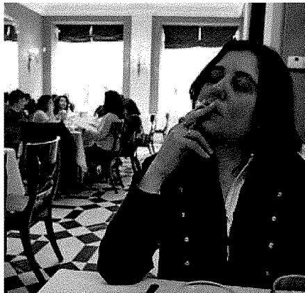
Un 30% menos de exposición al humo en cuatro años

La Federación Española de Hostelería calcula que la reforma legal dejará sin empleo a 200.000 trabajadores y que el sector perderá un 10% de la facturación. Desde la SEE, consideran que si se prohibiera fumar en todos los bares y restaurantes de España, se evitarían 1.000 muertes entre los trabajadores del sector. Según las recomendaciones de la OMS y la UE, todos los espacios públicos deberían estar libres de humo en 2012. El informe fue presentado en colaboración con la Agencia de Salud Pública y el Instituto Catalán de Oncología. ●