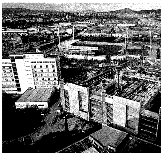
Las obras en Bellvitge están muy avanzadas

El nuevo edificio estará conectado tanto con las torres de hospitalización, como con el edificio de consultas externas, inaugura-